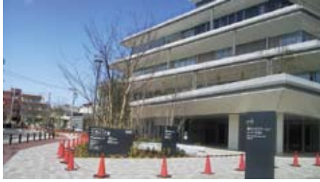
4月オープンの保健医療総合福祉プラザ「うめとびあ」

■ 三軒茶屋保健センターの区民健診は更衣室、健診時間帯に男女の別がなく、女性への配慮が足りない。梅が丘移転を機に見直しをお願いしました。