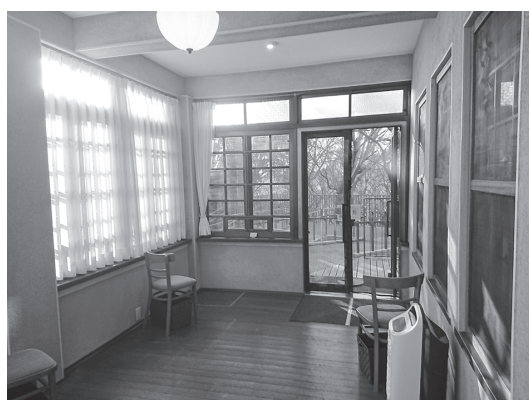
旧山田家住宅 ポーチ