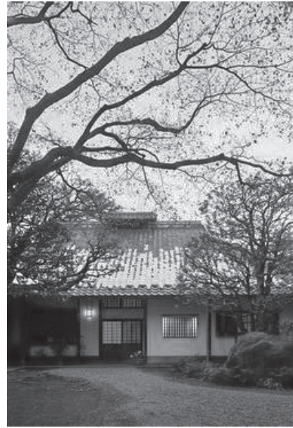
旧小坂家住宅