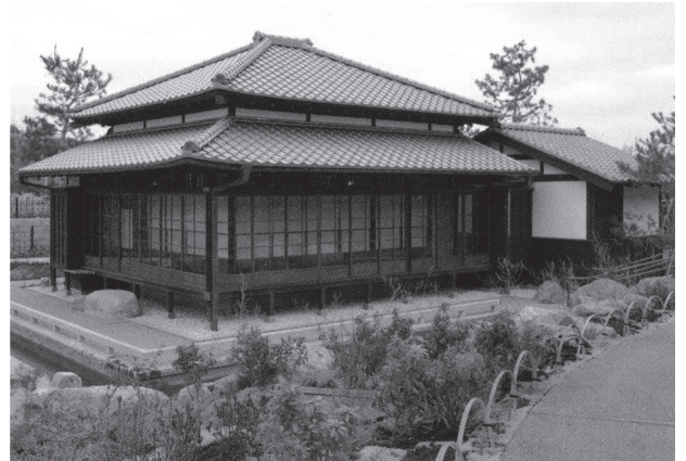
旧清水家住宅書院