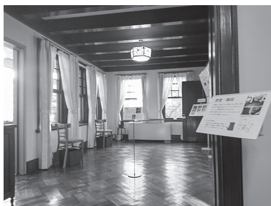
旧山田家住宅 居間