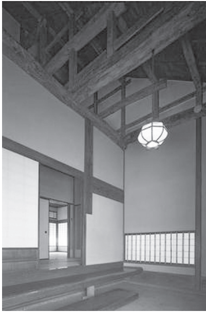
旧小坂家住宅