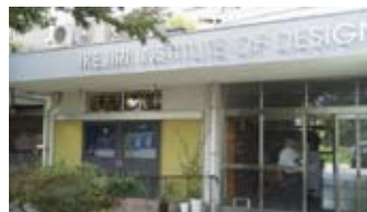
世田谷ものづくり学校

池尻中跡地を活用した起業支援拠点「世田谷ものづくり学校」が17年の幕を閉じる。現在入居している77社が可能な限り多く区内事業者として移転できるように区が支援することが必要だ。