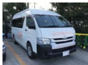
同型車両(実証運行用)

既存の民間バス路線の日中以降の補完策として、喜多見・宇奈根地域では予約により運行するオンデマンド交通(9人乗りワゴン)が本年下期より始まる。区は広報と地域の声のフィードバックに努め、事業者とともに円滑な交通網の維持を目指してほしい。