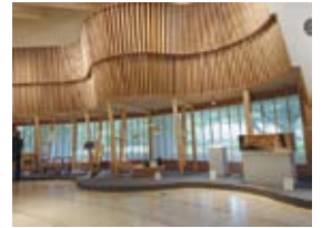
世田谷美術館「二人のアールト展」(2021年)より

ふるさと納税による約70億円の減収は深刻な問題だ。世田谷出身で区外で就労している人が実家のために納税したくなるようなサービス(例:植木の手入れや家事支援)、また文化芸術を感じられるアイテム(例:美術館パスポート)など、返礼品メニューを拡充してはどうか？