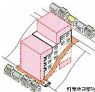
斜面地建築物(川崎市ホームページより)

Q 世田谷通りに面する成城の崖地で、崖下の建物解体中に擁壁が崩れ、高台の住民に避難指示が出た事故があった。自然災害でも人的災害でも、区民の住居が損なわれた時には区が支援する体制をとってほしい。また斜面地建築物は区内にも多くあり、事業者と所有者双方に施工や安全対策について注意喚起する必要はあるのでは？