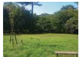
天然芝か、人工芝か

Q 区はみどり率33%を目指すのが宅地化により緑が減っている。手入れしやすい人工芝は緑化には貢献しないので、天然芝を一定程度取り入れるまちづくりのガイドラインが必要だ。ハイブリット芝など新技術の検討、地域住民の協力も得ながら低下するみどり率の回復をはかるべきでは？